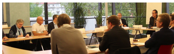
RÉGIONS GRAND-EST & BOURGOGNE-FRANCHE-COMTE

Débat organisé le 8 octobre 2019 avec le support de la Mairie de Strasbourg