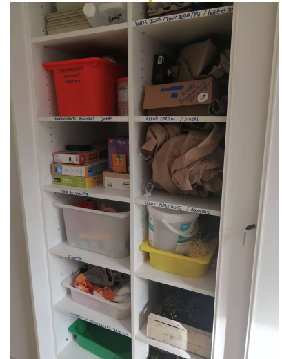
Armoire de jeux avec à droite les jeux d'occasion et à gauche le matériel de récupération (pommes de pin, mousses, plastique, cartons, boîtes d'œufs,...)